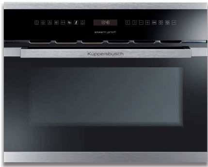
黑色，不锈钢设计套件（预先组装）