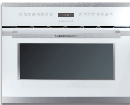
白色，不锈钢设计套件（预先组装）