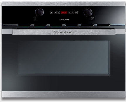
黑色，不锈钢设计套件（预先组装）