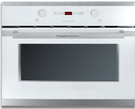
白色，不锈钢设计套件（预先组装）