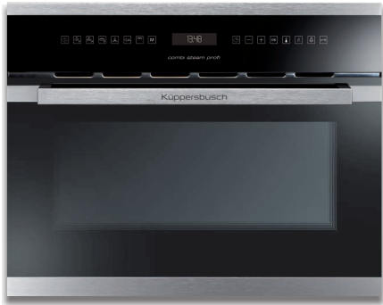
黑色，不锈钢设计套件（预先组装）